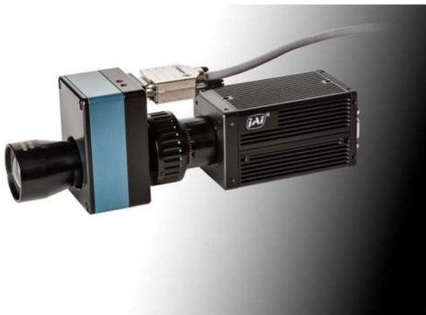
PANOVO tec Optisches Messsystem OMS 4.0

Die Lastenhefte vieler OEMs (nicht nur in der Automotiveindustrie) verlangen neben den klassischen AOI-Anforderungen wie Shape Matching und Pattern Matching zunehmend auch lichttechnische Analysen wie Leuchtdichte, dominante Wellenlänge und Farbort.