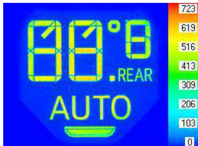
Leuchtdichteverteilung eines Anzeigeelements (Falschfarbendarstellung)

PANOVO tec setzt bei der V(\lambda) Filterung und bei der chromatischen Aberration auf einen rein softwarebasierten Ansatz. Dies ermöglicht eine sehr genaue und zugleich kostengünstige, kundenspezifische Kalibrierung und Justage.